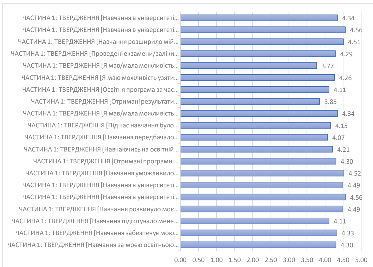
Рис. 2. Оцінювання студентами-випускниками реалізації освітніх програм другого (магістерського) рівня вищої освіти у НаУОА у 2022 році (макс.5 балів).

Я мав/мала можливість спілкуватись із роботодавцями під час навчання (зустрічі, обговорення, презентації).