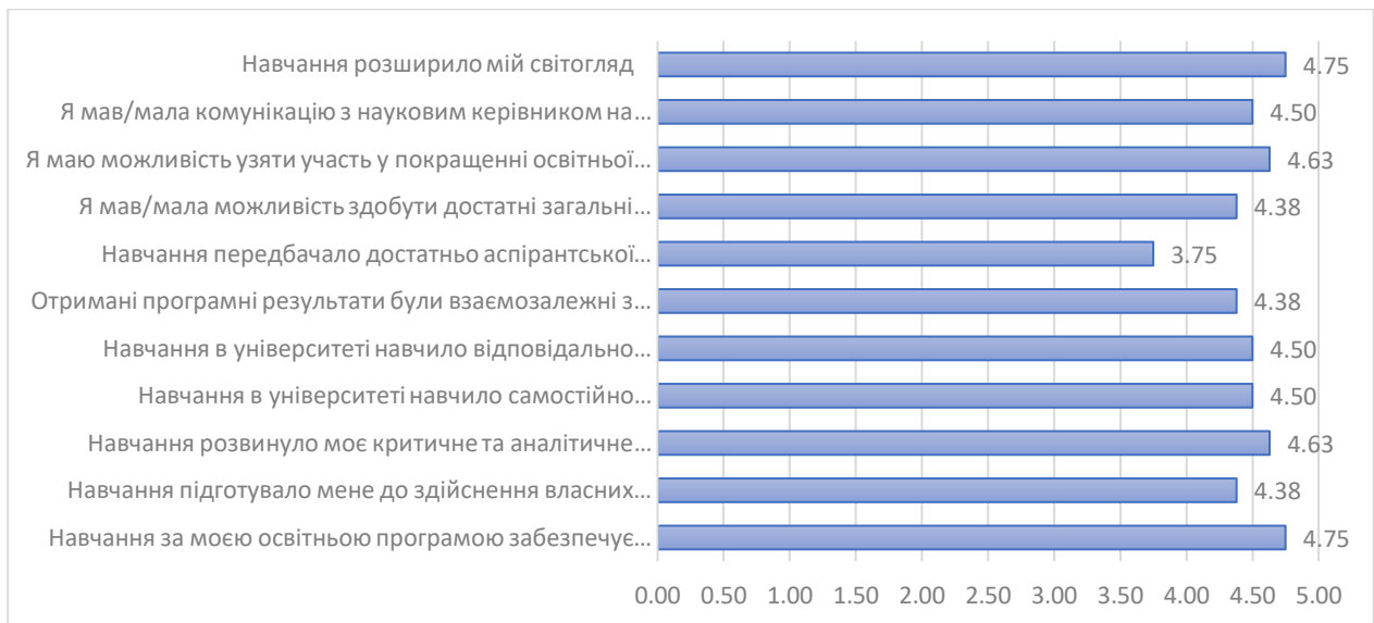
Рис. 3. Оцінювання випускниками реалізації освітніх програм третього (освітньо-наукового) рівня вищої освіти НАУОА у 2022 році (макс.5 балів).

Гарантам освітньо-наукових програм варто звернути увагу на найнижчу оцінку від випускників третього (освітньо-наукового) рівня вищої освіти щодо достатності аспірантської практики, та проаналізувати можливість покращення оцінок і за іншими твердженнями.