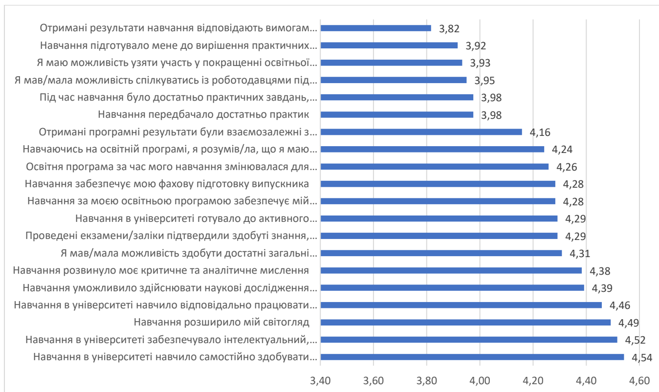
Рис. 2. Оцінювання студентами-випускниками реалізації магістерських освітніх програм НаУОА у 2021 році (макс.5 балів)

Щодо освітніх програм третього (освітньо-наукового) рівня, то опитування пройшли 50% випускників ОНП «Філологія», 33% ОНП «Психологія», 25% ОНП «Право». Середні оцінки за твердженнями відображені на рисунку 3.