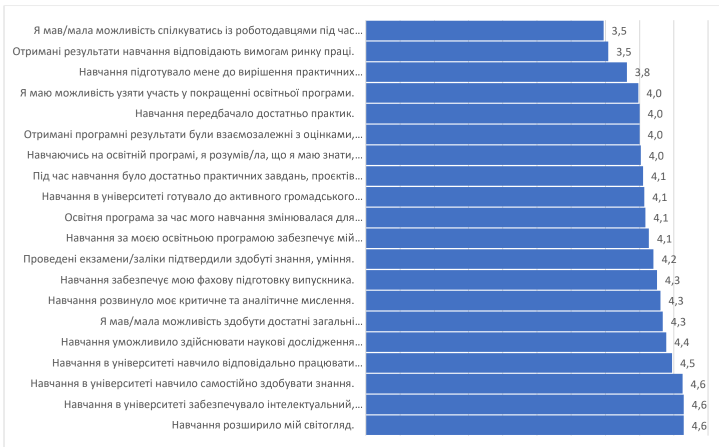
Рис. 2. Оцінювання реалізації магістерських освітніх програм НаУОА у 2020 році (макс.5 балів)

Отже, під час навчання на магістерському рівні вищої освіти варто активізувати зустрічі з роботодавцями, переглянути практичні завдання та вимоги них. Рекомендуємо провести відповідні обговорення на засіданнях кафедр чи груп забезпечень спеціальностей (результати за освітніми програмами надіслано гарантам програм) і врахувати оцінки та коментарі студентів.