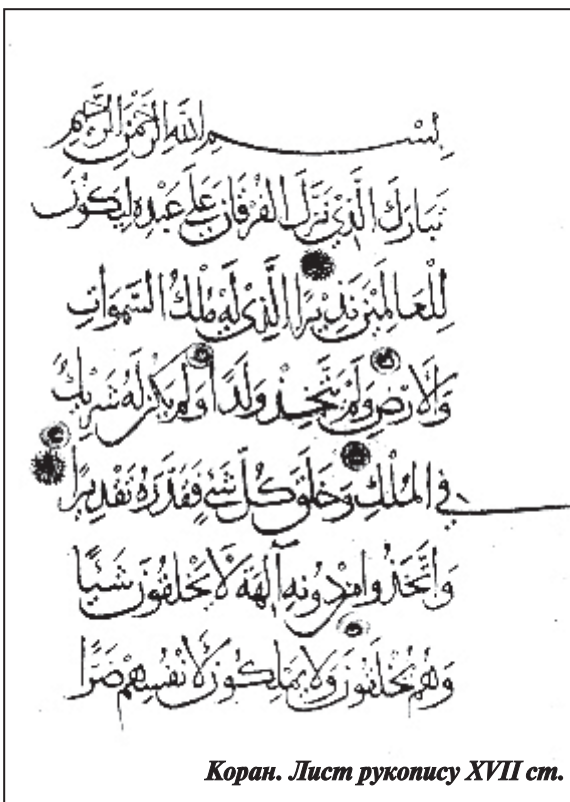
Коран. Лист рукопису XVII ст.

На відміну від Помпеїв і Геркуланума, знищених Везувієм у 79 році та чудово збережених під товстим шаром вулканічного попелу, Елея тривалий час зазнавала архітектурних змін та руйнувань. Близькість до моря теж мала подвійне значення: з одного боку, дозволяла провадити торгівлю, а з іншого – легко перетворювала місто на об’єкт нападу ворогів. Могутні фортеці й мури не завжди рятували жителів, але, попри бурхливу історичну долю, зберегли частину прадавніх споруд. Тому нині кожен охочий, сплативши при вході два євро та отримавши кілька філософських журналів (за двадцять п’ять століть “профіль” міста не змінився), може вільно оглянути стародавній храм бога медицини Аскле-