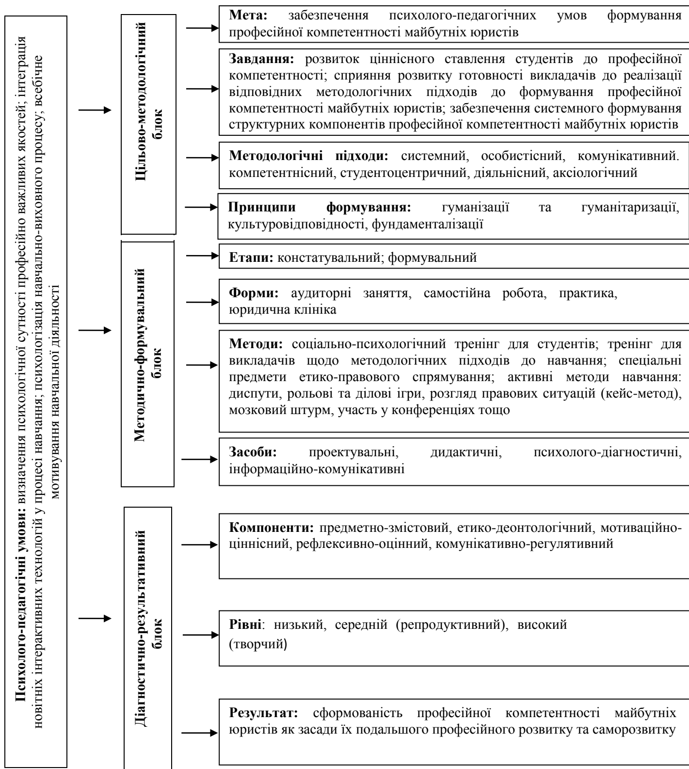
Рис. 1. Модель формування професійної компетентності майбутніх юристів