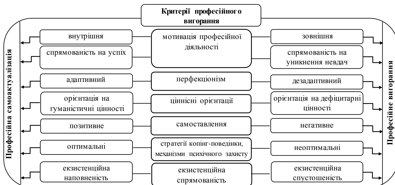
Рис. 1. Базова схема психологічних критеріїв професійного вигорання у вихователів дитячих (дошкільних) навчальних закладів

Дослідники вказують на такі основні об'єктивні передумови професійного вигорання вихователів ДНЗ: підвищена відповідальність за життя й здоров'я дітей, що вимагає самовідданості; істотний дисбаланс між зусиллями та матеріальною й моральною винагородою; неефективне нормативне регулювання.