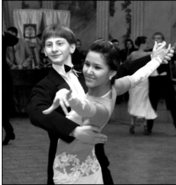
Учасники зразкового ансамблю сучасного танцю «Ритм»

Отже, 12 лютого, близько шостої години вечора, незважаючи на дощ,