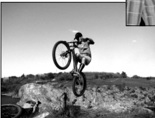
Вау! Ризиковано, Льоша! За це платять, але ви б наважились?

Коли ми були маленькими, всі мріяли стати кимось. У нас були величезні плани і сміливі мрії. У нас були пристрасні захоплення певним видом спорту, гуртком чи школою мистецтв. Деякі з нас живуть цим захопленням і досі.