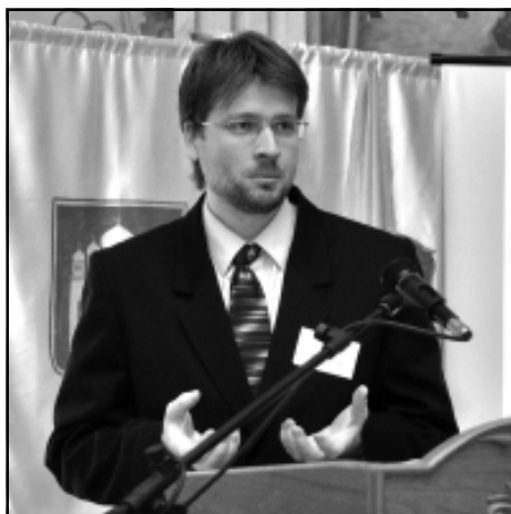
Доктор психології Стокгольмського та Унсонського університетів Фредрік Джонсон

19 лютого у Національному університеті «Острозька академія» відбулася Міжнародна конференція з когнітивної психології. Це була перша спроба в Україні зібрати